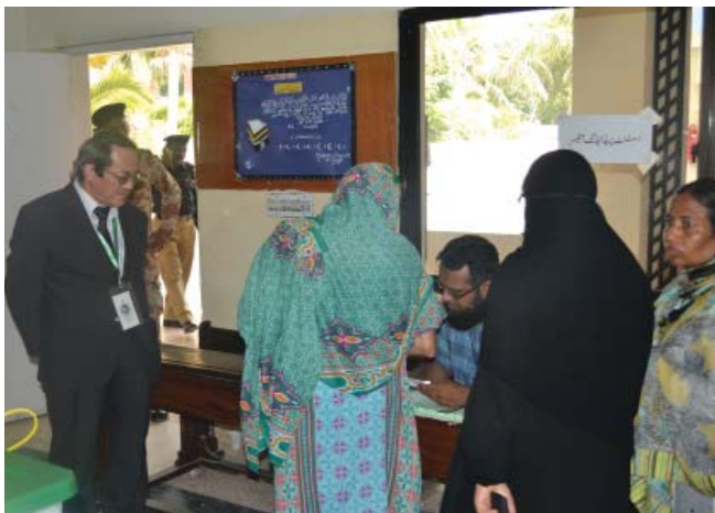
Karachi: The Consul-General of Japan, Mr. Akira Ouchi observing the voting process.

(1) Despite attacks against candidates by the Tehrik-i-Taliban Pakistan (TTP) and some disturbances reported at a limited number of areas, the people of Pakistan have overcome the difficulties and the election was conducted by and large successfully and peacefully. This election was highly significant for the democratic process in Pakistan. On the other hand, the fact that more than 100 people were killed during the election time should be seriously considered. We express our sympathy for the victims and condemn terrorism in all its forms and manifestations. We expect the next administration to continue to tackle this issue.