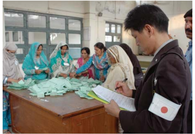
Islamabad: A member of the Japanese Election Observer Mission observing voting process at a polling station.

3. This was the first general election in Pakistan that was conducted after the completion of the full five year-term of the National Assembly. The election was a key test for the consolidation of democracy in Pakistan. In light of its significance, the Government of Japan extended a grant aid worth $2 million through United Nations Development Programme (UNDP) to support the electoral process in Pakistan, including (i) polling staff training, (ii) development of elections results management system, and (iii) voter education and public outreach.