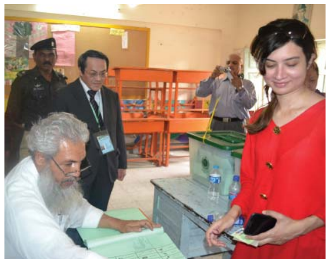
Karachi: The Consul-General of Japan observing the vote casting process.

(4) As a whole, there were improvements in terms of the fair elections, although some electoral fraud was reported. As far as our mission's observation is concerned, not even a small electoral fraud was detected and this could be evaluated as the great advance towards the democracy. In particular, it could be appreciated that many female voters appeared to the polling stations even if there is still significant difference between the number of male and female voters.