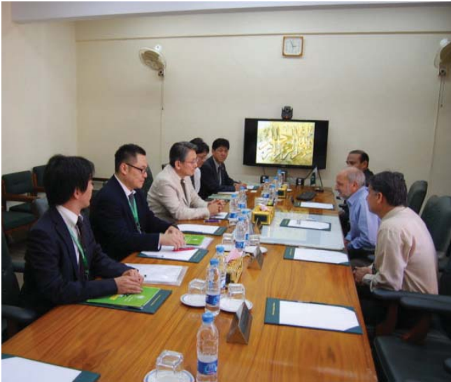
Islamabad: The Japanese Election Observer Mission meeting the officials of the Election Commission of Pakistan.