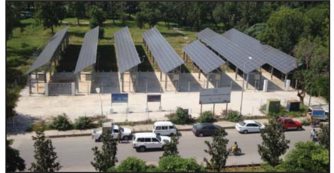
Japan provided first on-grid solar power station site in Islamabad, Pakistan.

In December 2012, the two governments of Japan and Pakistan signed two agreements for "The Project for Improvement of Child Health Institute in Karachi" and "Rehabilitation of Medium Wave Radio Broadcasting Network". "The Project for Improvement of Child Health Institute in Karachi" intends to construct new health facility and provision of necessary medical equipment. The