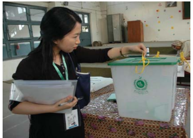
Islamabad: A member of the Japanese Election Observer Mission inspecting the voting process at a polling station.